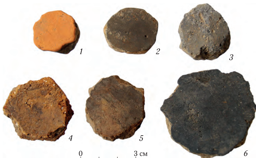
Рис. 3. Игральные фишки Краскинского городища, изготовленные из стенок сосудов и черепицы