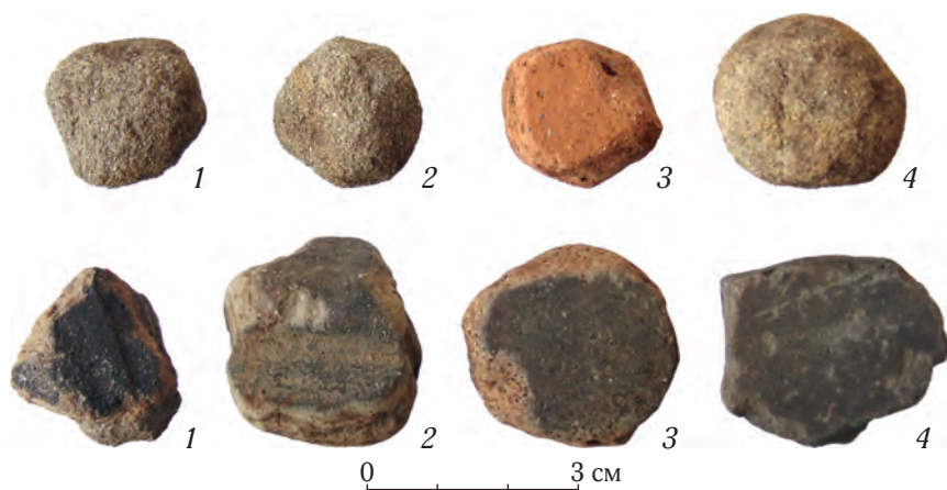
Рис. 2. Игральные фишки Краскинского городища, изготовленные из камня (1, 2, 4) и стенок сосудов (3, 5, 6, 7, 8)

и др., 2010; Прокопец, 2013). До сих пор игральные фишки не привлекали особого внимания исследователей, и лишь в отдельных работах при описании археологического материала указывалось, что они использовались для игры в облавные шашки (Хорев, 2012: 95—96). В данной статье представлены результаты количественного и пространственного анализа игровых фишек на Краскинском городище в пределах разных объектов из нескольких строительных горизонтов. Кроме того, ставилась задача уточнить, для какой игры могли использоваться фишки и каковы правила этой игры.