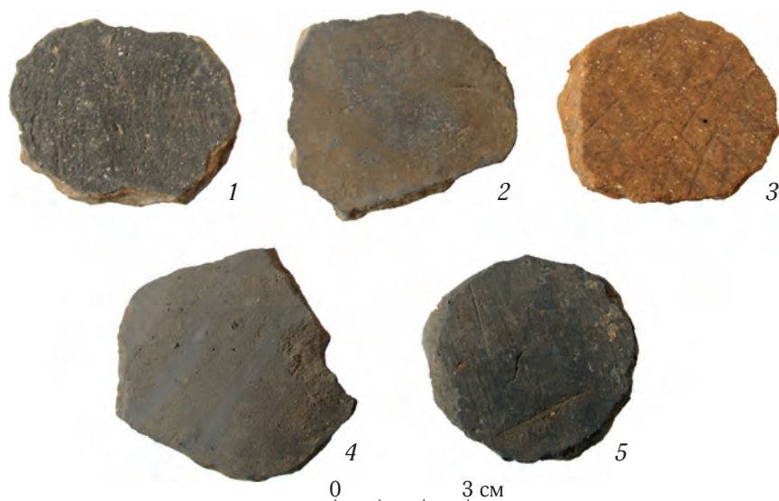
Рис. 1. Игральные фишки Краскинского городища, изготовленные из стенок сосудов

В настоящее время из бохайских памятников Приморья известно значительное количество артефактов, которые по давно сложившейся традиции и не без основания называют игральными фишками. Наибольшее их количество собрано на Краскинском городище, где они относятся к категории массовых находок. На других памятниках эти артефакты тоже находят, но пока в единичных случаях — на городищах Горбатка, Николаевское-1 и поселениях Константиновское-1, Чернятино-2 (Гельман, 2005: 421, рис. 172: 3; Никитин, Чжун Сук-Бэ, 2009; Болдин