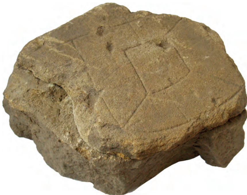
Рис. 4. Игральное поле, начерченное на камне, найденное во время археологических работ на Краскинском городище

На Краскинском городище во время раскопок черепичной камеры была сделана интересная находка — расчерченный камень (рис. 4). Исследователями памятника было высказано предположение, что он использовался для игры. Аналогичные поля в мировой археологии известны из разных мест и датируются разными периодами. Так, на одном из камней, которыми вымощена дорога в г. Джераш в Иордании, прочерчено аналогичное миниатюрное поле для игры. Датируется памятник первыми веками н. э. В музее г. Лояна есть керамический стол любо . Эта находка отнесена к эпохе Восточная Хань (25—220 гг. н.э.). На поверхности стола имеется изображение, по всей видимости, игрального поля. Оно отличается от поля для игры из Краскинского городища тем, что отсутствует изображение внутреннего квадрата. На уйгурском городище Хара-Балгасун (Орду-Балык) (VIII—IX вв.) была обнаружена керамическая доска с изображением игрального поля, аналогичного краскинскому. Исследователи