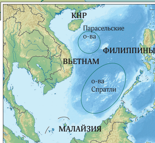
Рис. 2. Акватории районов территориальных споров в Южно-Китайском море