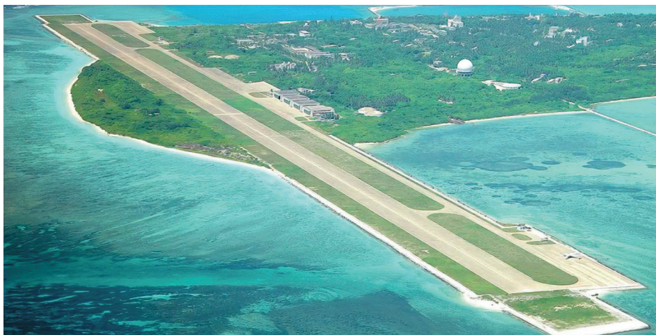
Рис. 4. Город Саньша на острове Вуди (Буазе, Юнсиндао)

КНР инвестирует сотни миллионов юаней в инфраструктуру и развитие острова, на котором продолжается большая строительная деятельность, чтобы подкрепить свои территориальные претензии по архипелагу. В последние годы о. Вуди (рис. 4) получил модернизированный аэропорт