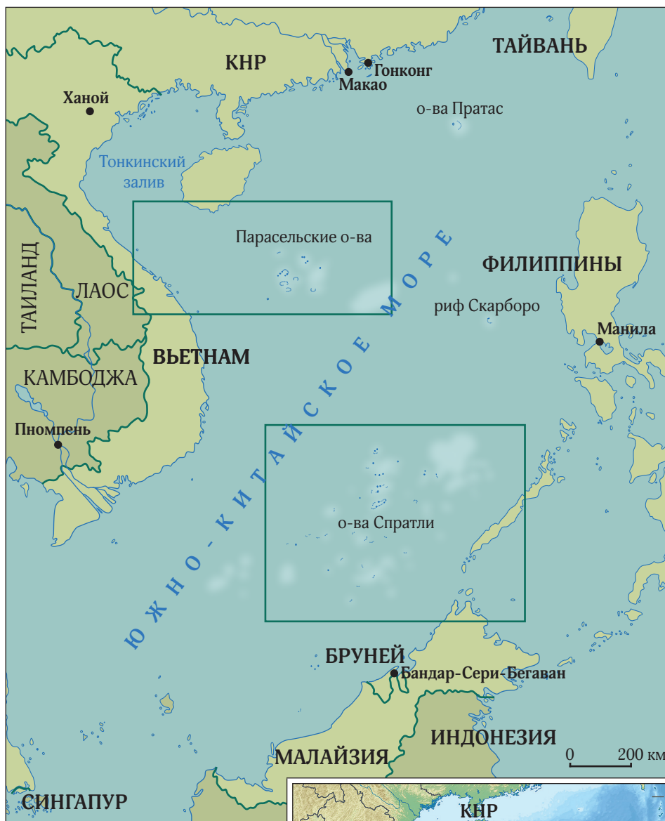
Рис. 1. Районы территориальных споров в Южно-Китайском море