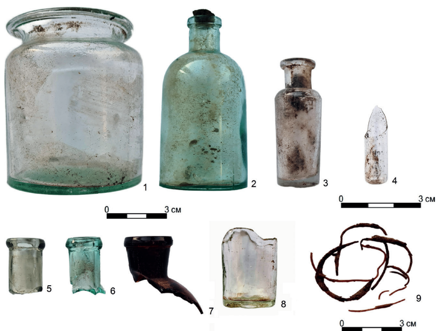
Рис. 3. ОАН «Город Гижигинск», предметы аптекарского дела и медицины из археологической коллекции 2020 г.: 1—3 — целые ёмкости из стекла; 4 — фрагмент ампулы; 5—7 — горлышки от стеклянных ёмкостей; 8 — донная часть стеклянного пузырька; 9 — фрагменты контрацептивов (резинки от презервативов)