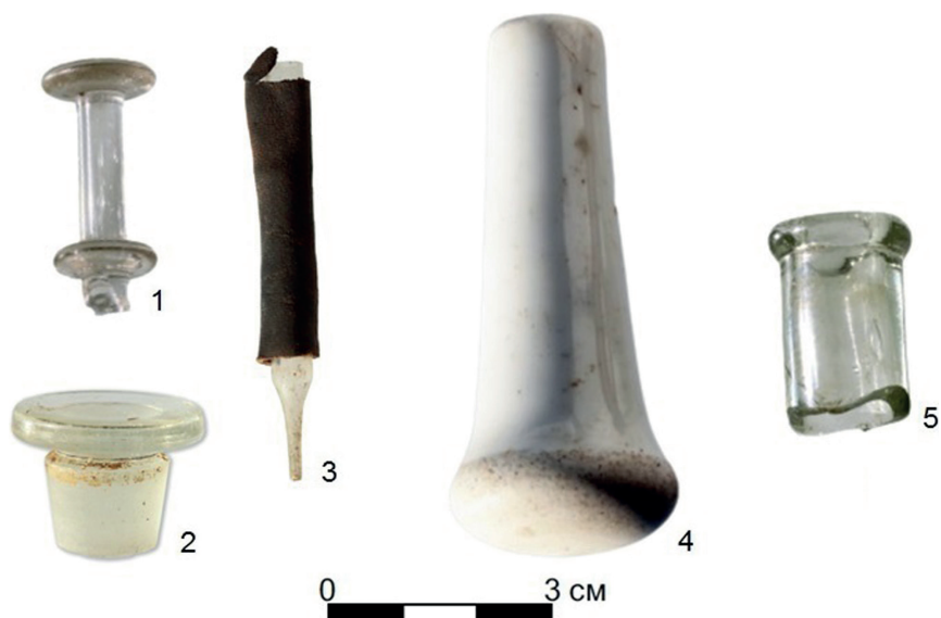
Рис. 2. ОАН «Город Гижигинск», предметы аптекарского дела и медицины из археологической коллекции 2020 г.: 1 — обломок поршня медицинского шприца; 2 — стеклянная аптекарская пробка; 3 — пипетка; 4 — керамический аптекарский пест; 5 — обломок аптекарской ёмкости