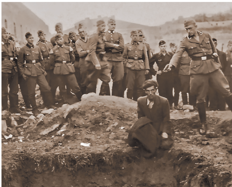
Рис. 1. Одна из наиболее известных фотографий массовой казни местных жителей в г. Бердичеве, 28 июля 1941 г.