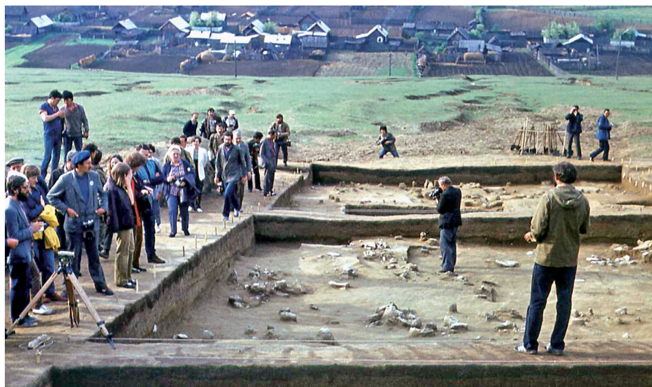
Рис. 6. Участники всесоюзной конференции «Четвертичная геология и первобытная археология Южной Сибири» на поселении Толбага. 1986 г.