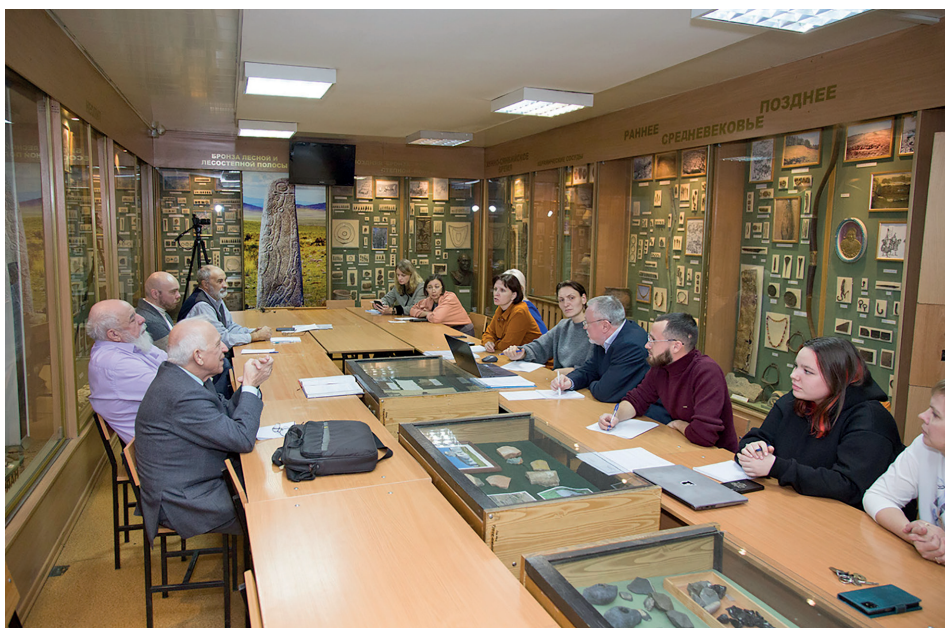
Рис. 5. Музей археологии Забайкалья им. И.И. Кириллова. 2024 г.

«Планиграфический анализ жилищно-хозяйственных комплексов верхнего палеолита Забайкалья» И.И. Разгильдеевой (2018).